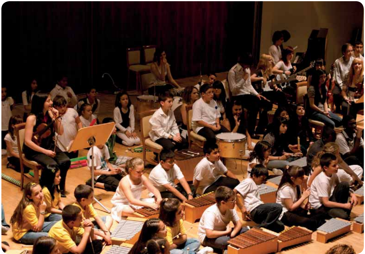
Concierto final en Sala de Cámara; proyecto "Alexander Nevsky", 31 de mayo de 2011

En mayo de 2007 se desarrolló El laberinto de la Música, taller realizado con 26 alumnos de Educación Primaria en el Auditorio del Museo del Centro Nacional de Arte Reina Sofía.